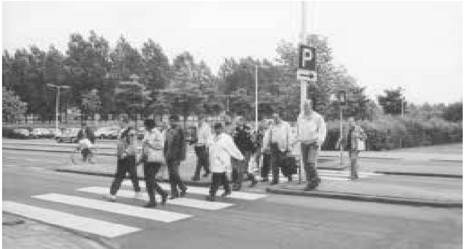
Medewerkers van Multibedrijven na gedane arbeid naar huis.