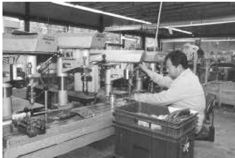
Een werknemer bij een handbediende freesmachine

De laatste tijd heeft MultiBedrijven met enorme veranderingen te maken, met name op het gebied van de wetgeving. Die wetten zijn onder andere de nWSW (nieuwe Wet Sociale Werkvoorziening), de REA (Wet op de (re)integratie arbeidsgehandicapten.), de WIW (de Wet Inschakeling Werkzoekenden). Men zit nu in een proces dat men de organisatie aan moet passen aan de veranderde wetgeving. Dat betekent ook dat ze een meer gevarieerder doelgroep binnenkrijgen. Langdurig werklozen bijvoorbeeld krijgen op die manier weer het