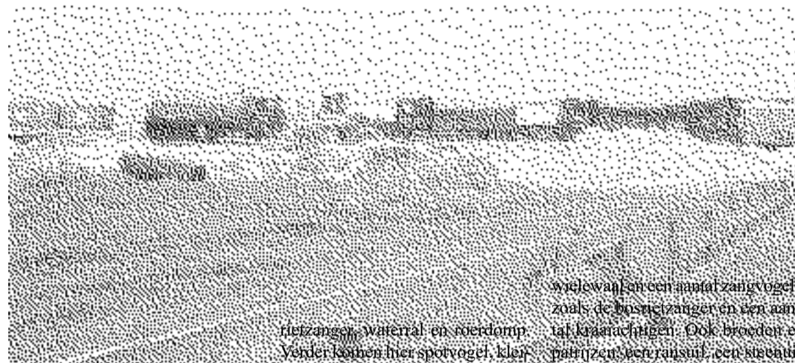
Op dit moment is men bezig met het bouwen van een aantal Nesselande

donderpad en kolblei, kleine modderkruiper, bittervoorn, ruisvoorn, pos en riviergrondel.