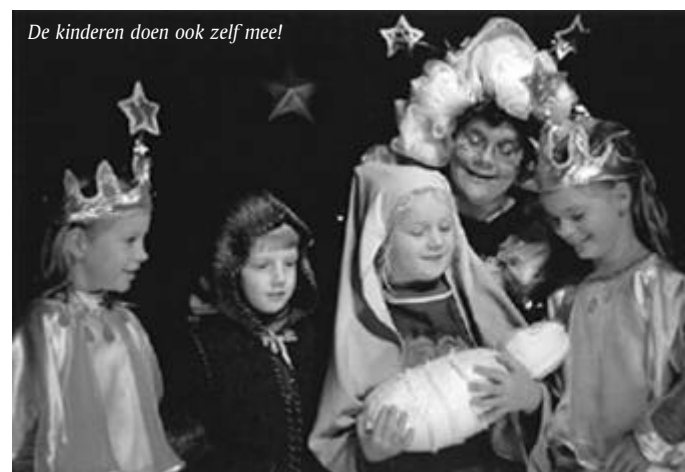
De kinderen doen ook zelf mee!