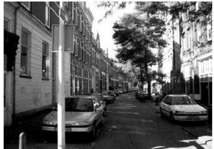
Schoonoordstraat zoals die nu is, gezien vanaf de Bergweg. Midden links was nummer 15