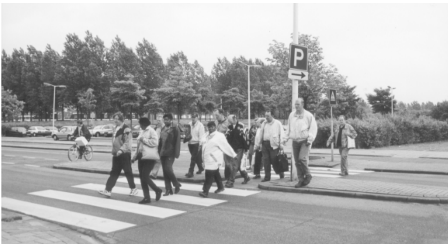
Medewerkers van Multibedrijven na gedane arbeid naar huis.

De laatste tijd heeft MultiBedrijven met enorme veranderingen te maken, met name op het gebied van de wetgeving. Die wetten zijn onder andere de nWSW (nieuwe Wet Sociale Werkvoorziening), de REA (Wet op de (re)integratie arbeidsgehandicapten.), de WIW (de Wet Inschakeling Werkzoekenden). Men zit nu in een proces dat men de organisatie aan moet passen aan de veranderde wetgeving. Dat betekent ook dat ze een meer gevarieerder doelgroep binnenkrijgen. Langdurig werklozen bijvoorbeeld krijgen op die manier weer het