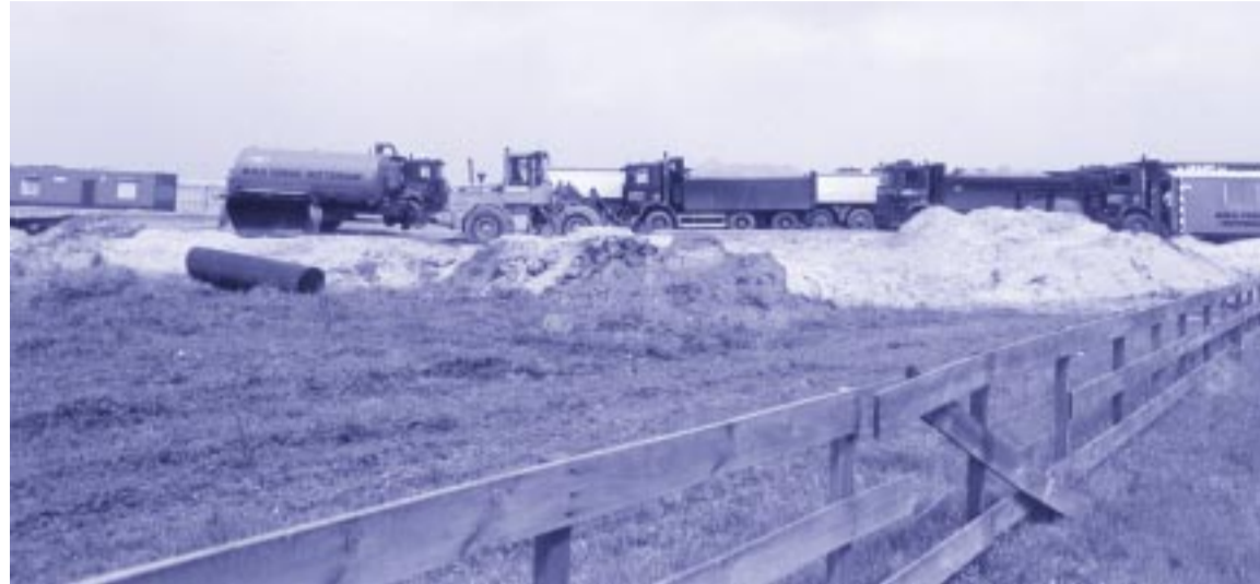
Op dit moment is men bezig met het bouwrijp maken voor de nieuw te bouwen wijk Nesselande

bevestigen dat het een matig voedselrijke plas is met goede waterkwaliteit op minerale bodem. Wat betreft de fauna is er een hoog percentage roofvis van voornamelijk baars en snoek en in mindere mate snoekbaars. Dit kunnen zeer grote exemplaren zijn. Verder