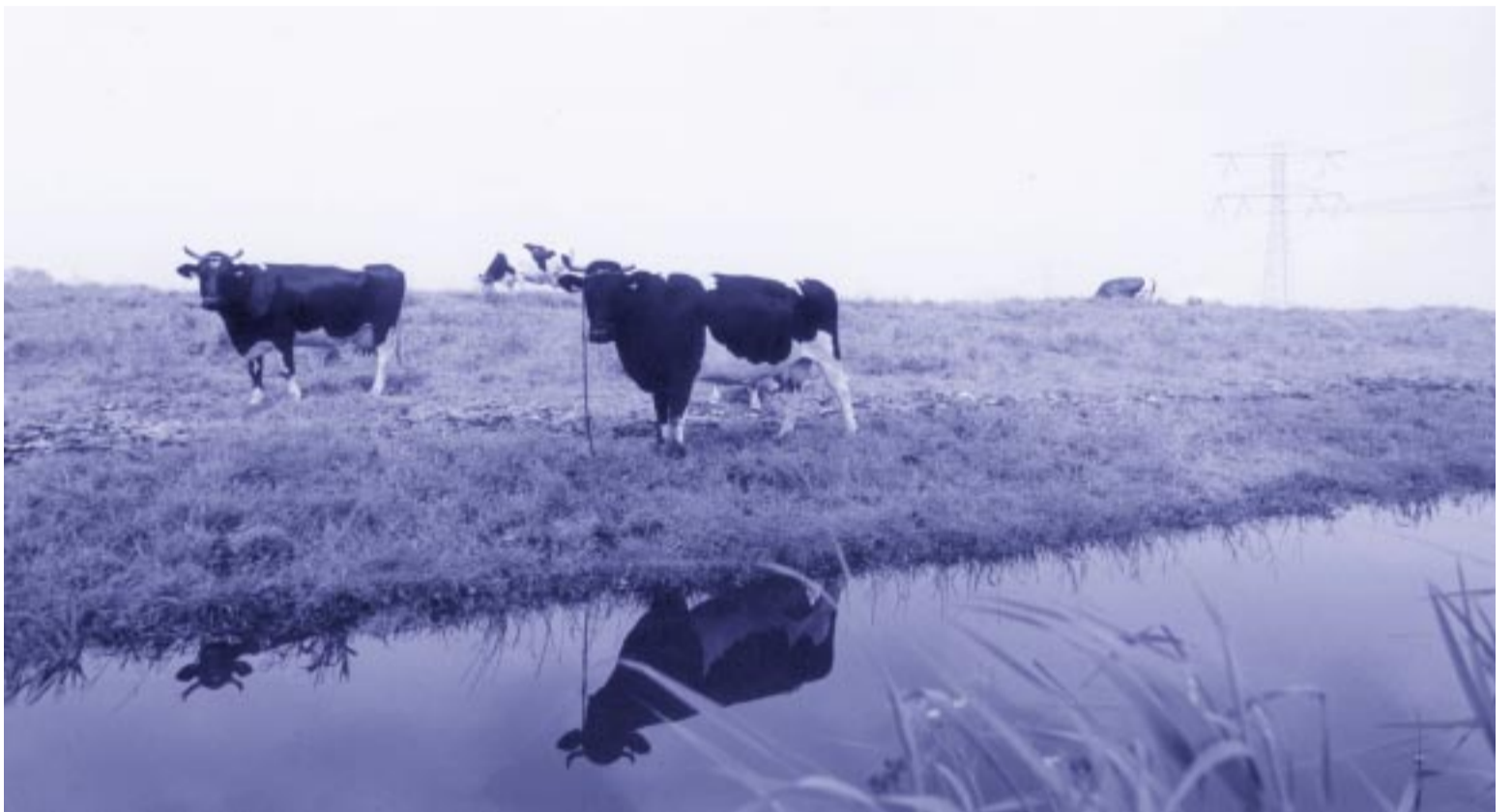
Door de ontwikkeling van Nesselande gaat er een groot poldergebied verloren

De vergroting van de Zevenhuizerplas betekent in ieder geval een vergroting van de recreatieve ruimte, zowel wat betreft de watersport als oeverrecreatie. Maar wat betekent dit alles voor de natuur? vervolg op pagina 4