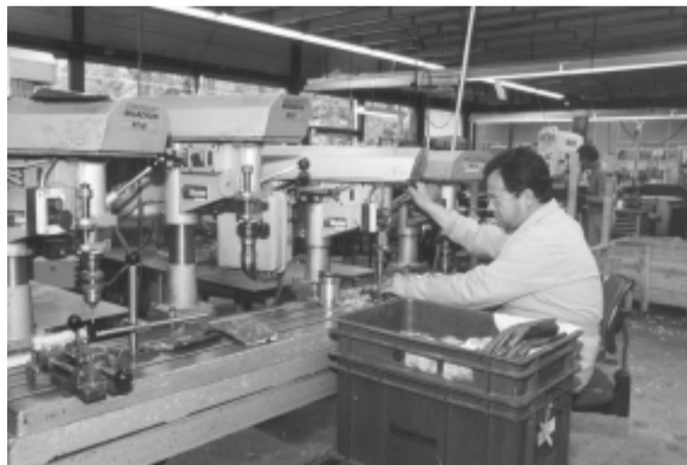
Een werknemer bij een handbediende freesmachine

En dat is alleen nog maar de locatie aan de Roer. We hebben het nog helemaal niet gehad over de locatie aan het Zuidlaardermeer. Waar MultiBedrijven ook trots op is, is een handig apparaatje dat ze aan het Zuidlaardermeer uitgevonden hebben om snoeren op te winden, een zogenaamde cableturtle. Ook is daar een naaiatelier waar ondermeer operatiedoeken worden gemaakt. Op de inpakafdeling worden diverse producten verpakt.