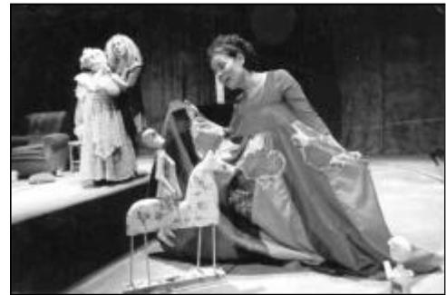
O Muro 7+ : Munganga

Jongerenactiviteit i.s.m. jongerenwerk Meer informatie via het LCC Donderdag 30 maart 2006. Aanvang 19.30 uur. Entree € 3,00 met RotterdamPas € 2,25.