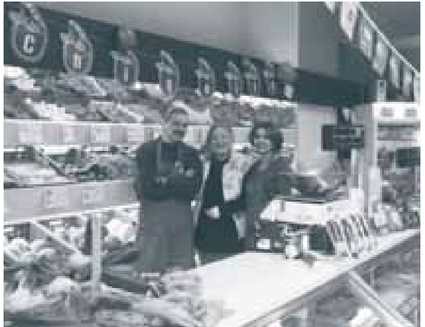
Met al onze groeten en fruit met u toch beter uit. Aldus Puck & Mila.

Variatie En dan natuurlijk de variatie in het aanbod. Vooral op fruitgebied heeft Puck veel te bieden.