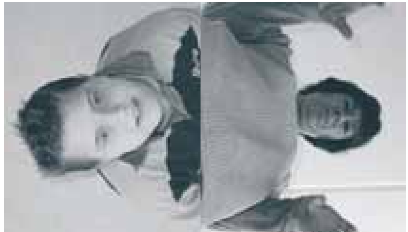
En hoe zit het nou met het gezag over het kind?

Soms gebeurt het dat de rechter zich wil laten adviseren. De Raad voor de Kinderbescherming is dan de daartoe aangewezen instantie. Deze onderzoekt de situatie, onder meer door met beide ouders te spreken, en brengt na afloop van het onderzoek een rapport aan de rechtbank uit. Daarna wordt dit rapport door de rechter met de ouders en hun advocaten besproken, waarna een beslissing wordt genomen. Het betreft een uiterst langdurige en vaak pijnlijke procedure die tot het uiterste voorkomen dient te worden.