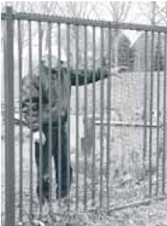
Aad toont het door vandalen gesloopte hek van TakaTukaland.