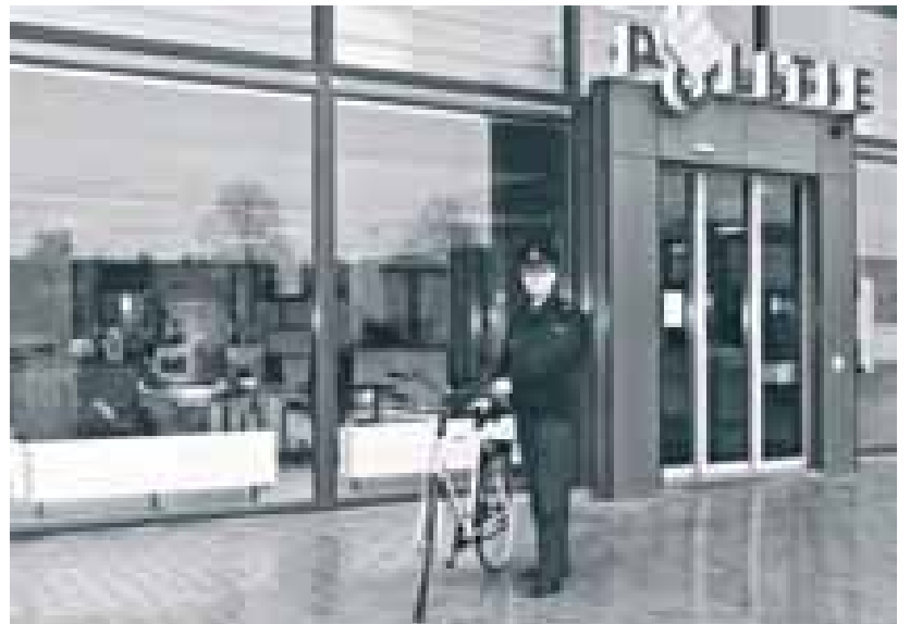
Nieuw Politie bureau in Woongebouw aan de Zevenkampse Ring.

De nieuwe buurtagent zal volgens de Nijs, om goed te kunnen functioneren, zoveel mogelijk netwerken. Hij houdt contact met alle organisaties die er in de buurt zijn en zal, waar nodig, met hen samenwerken. Daarbij zal de agent zoveel als mogelijk op straat zijn. Mensen zullen de agent dus regelmatig treffen en de agent zal weten wat er zijn buurt allemaal speelt. Buurtagenten hebben ook een coachende functie voor toezichthouders, veilig-