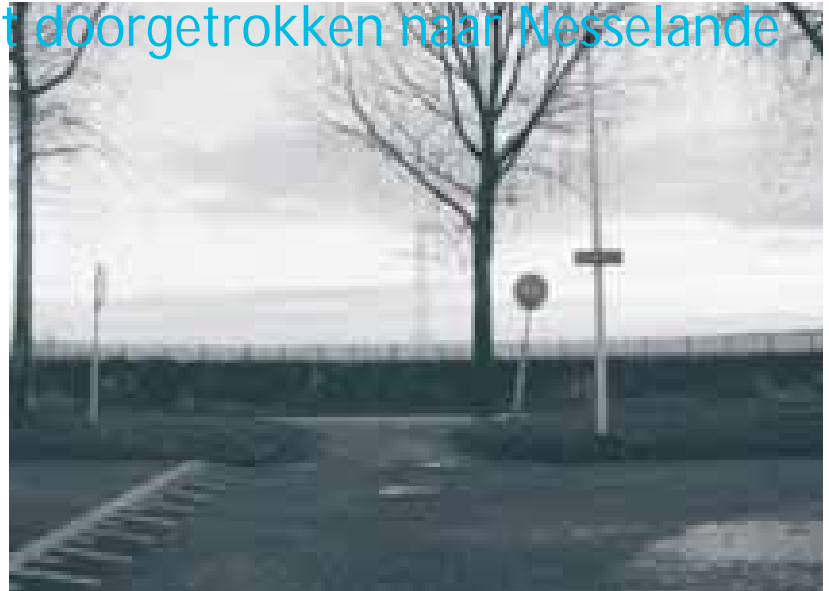
Hier komt de nieuwe weg van en naar Nesselande.

Ook worden bij de kruisingen op de Zevenkampse Ring met de Capelseweg verkeerslichten geplaatst en bestaat het plan om de weg in de bocht (waar is dit precies) smaller te maken. De achterliggende gedachte hierbij is dat een automobilist op een smallere weg automatisch vaart zal minderen, waardoor het, met name voor overstekende kinderen, toch nog te doen is veilig de overkant